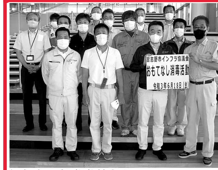
習志野市インフラ協議会（岩井健会長）は18日、民の安全・安心確保に貢献する事業として、2020年度に引き続き、新型コロナウイルス感染症拡大防止のため、同日市庁舎で消毒活動を実施した。一般市民が訪れるフロアを中心に、カウンタなど不特定多数の人が利用する椅子やテーブルなどの消毒場所を事前に早期に消毒するなど、21年度も日常の業務と併せて市民の安全・安心確保に貢献することを期している。

今後、24日に開かれる町議会臨時会に工事請負契約締結案を提出し、町議会の承認が得られれば、月内にも着工する予定だ。