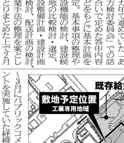
既存給食センターと敷地予定位置の工業専用道路