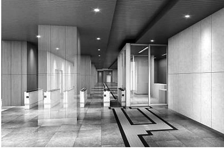
海老川新駅改札外コンコースから改札内を望むイメージ図

松戸市は、スポーツ施設整備方針をとりまとめ、旧根木内東小学校跡地にアーバンスポーツやサッカー、ラグビーなどの運動施設を新設し、新松戸下水処理場跡地にテニスコートを整備する方針を示している。 市では、2022年11月に「松戸市スポーツ推進計画」を策定した。同計画の推進にあたっては、既存の公共スポーツ施設の維持保全とともに、多様な市民ニーズに対応した施設の整備と充実が課題となっている。 そこで、既存の公共スポーツ施設の現状を調査・分析し、現状の市民ニーズに対応した公共スポーツ施設の整備方針を策定した。 整備方針は、スポーツ施設整備方針をとりまとめ、旧根木内東小学校跡地にアーバンスポーツやサッカー、ラグビーなどの運動施設を新設し、新松戸下水処理場跡地にテニスコートを整備する方針を示している。